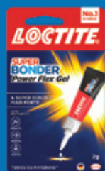
Cartela Power Gel 2g