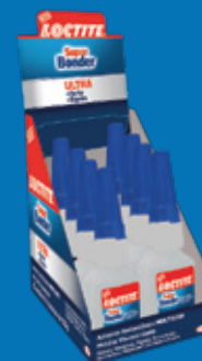
Cartela com 8 unidades