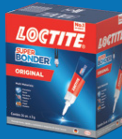
Caixa Display Original 3g