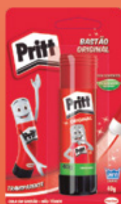
Cartelas com 1 unidade