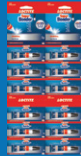
Cartelão Original 3g

IDH 2677335 Super Bonder Original 3g EAN 7891200190942 DUN 37891200190943 Caixa com 24 unidades