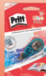
Cartela com 1 unidade

IDH 2138002 Pritt Micro Rolly 5mm x 6m EAN 7891200011100 DUN 17891200011107 Caixa com 24 unidades