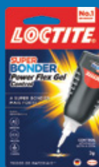
Cartela Power Gel Control 3g