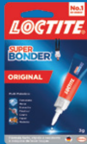
Cartela Original 3g